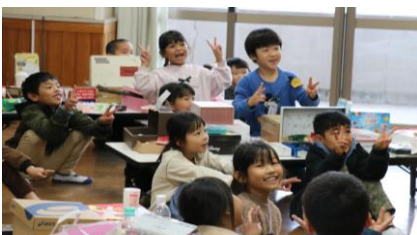
【5年「ふるさと郷原」の魅力再発見】